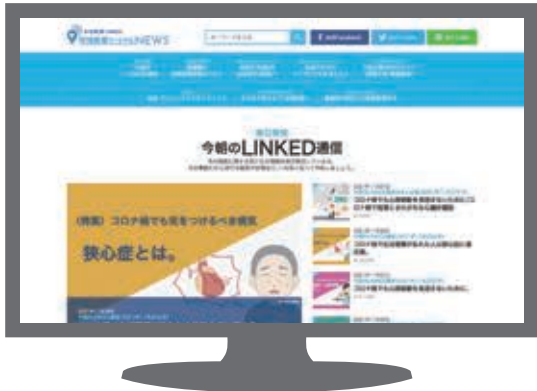
▲地域医療ソーシャルNEWSトップページ

地域医療ソーシャルNEWS内に、①疾患についての基礎知識、②病院発疾患関連記事、③セルフチェックという3種類のコンテンツ・機能をまとめた〈疾患カセット〉を配置し、疾患単位でユーザーの興味を集めます。