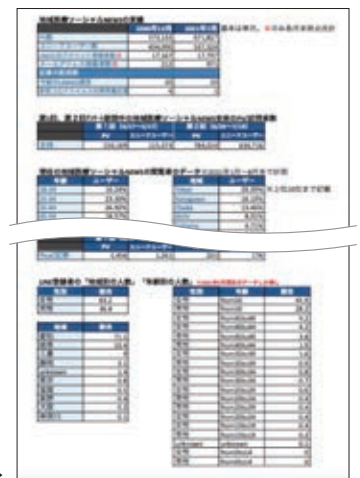
マーケティングデータイメージ▶

入手したい情報を起点に企業ごとにプランを完全個別設計するため、必要なデータをピンポイントで集めることが可能です。