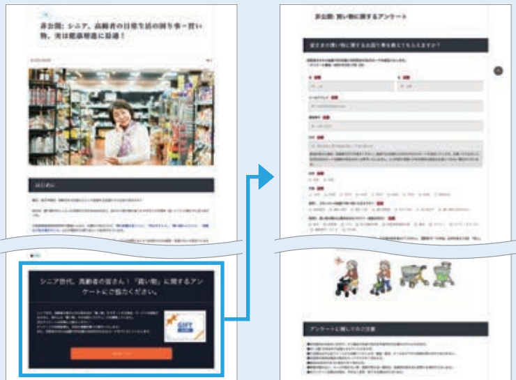
▲記事コンテンツのイメージ

歩行者や杖といった介護用品に関するニーズ調査のため、買い物の際の困りごとや不便だと感じる瞬間などを、アンケートで収集しました。その際、関連記事として買い物と健康寿命に関する内容を掲載し、興味を持った生活者が記事からアンケートページへ自然と誘導されるように設計。ターゲット層である高齢者から、潜在ニーズを多く取得することができました。