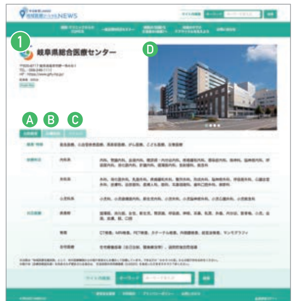
WEBマガジントップページ▶