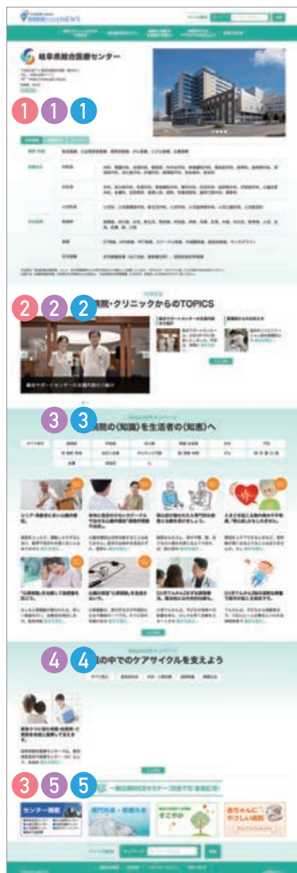
▲WEBマガジントップページ