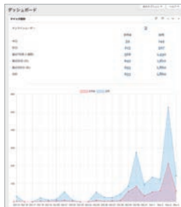
▲サイトアクセスのアナリティクス機能のイメージ

ダッシュボード上から、アナリティクスデータの閲覧が可能。当日、直近1ヵ月、年間などの期間アクセス数を確認することができます。