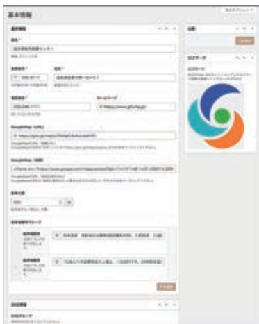
▲ダッシュボード機能のイメージ(例:基本情報)

医療機関の①基本情報(A当院概要 B診療情報 Cアクセス Dトップイメージ)の登録・編集ができます。