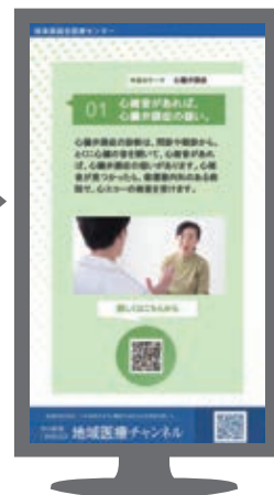
◀デジタル 掲示板 (サイネージ)